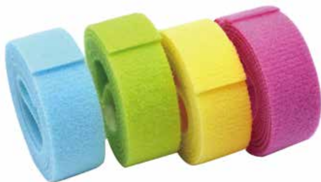
光ファイバーブルー 光ファイバーグリーン 光ファイバーイエロー 光ファイバーピンク

既存の 10 色に「光ファイバーカラー」4 色を新たに追加。ケーブルの用途や種類に合わせて、より詳細な色分けが可能です。