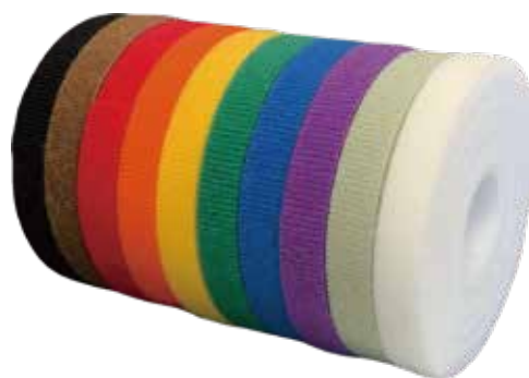
既存 10 色